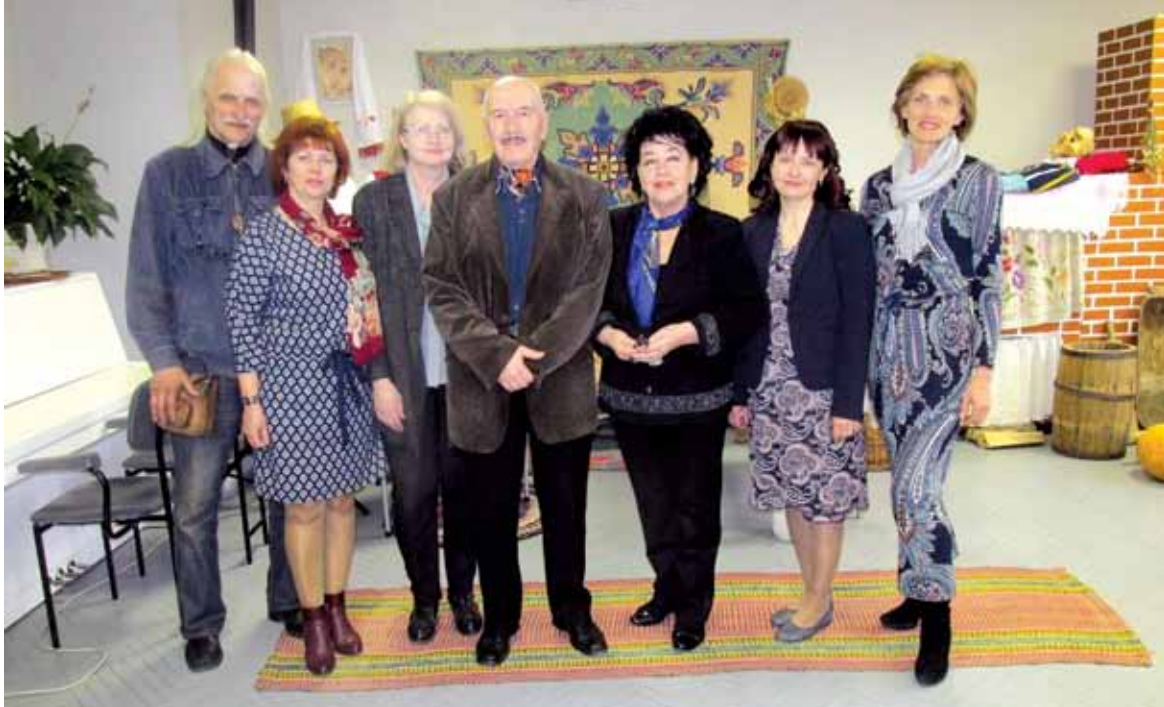
Мастакі з суполкі “Маю гонар” у Цэнтры беларускай культуры

Другая ж выстава, пра якую хочацца расказаць, ладзілася ў Цэнтры бе-